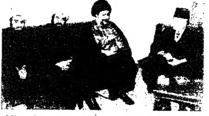
بعد زيارة القصر قام الرئيس قاص الذي صلح بزيارة قصر المجلس الشامي الاعلى فاستقبله سماحة الامام موسى الصدر بحضور الشيخ محمد مودي شمس الدين، ثم استقبل الامام الصدر سفير الكويت السيد عبد الحميد البهيان.